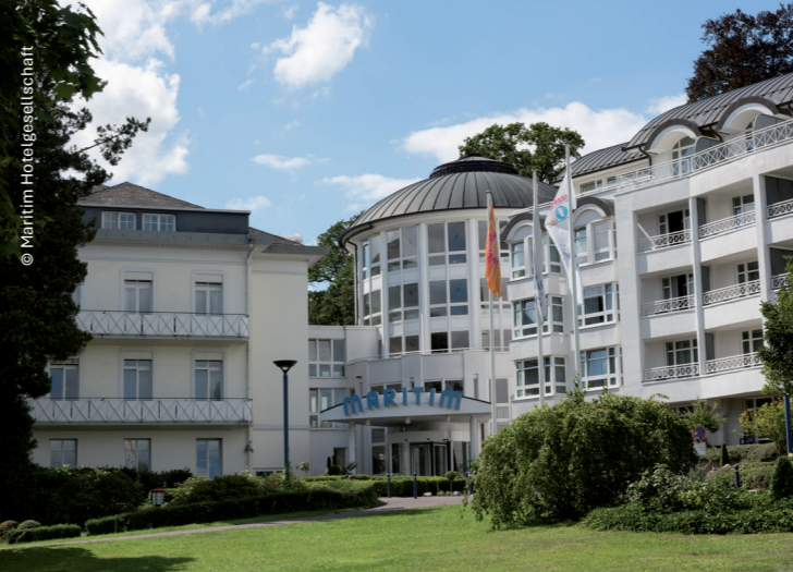
Maritim Hotel Bad Wildungen